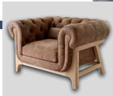
Fauteuil COCOON CHESTERFIELD Chêne, assise cuir / 9 finitions disponibles Oak, leather seat / 9 available finishings L122 P96 H77 cm - réf. F278