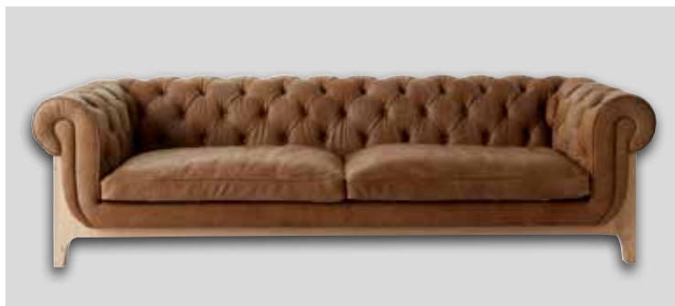
Canapé COCOON CHESTERFIELD Chêne, assise cuir / 9 finitions disponibles Oak, leather seat / 9 available finishings 4 places/seater L275 P96 H77 cm - réf. F277 4S (photo) 3 places/seater L232 P96 H77 cm - réf. f277 3S 2 places/seater L184 P96 H77 cm - réf. F277 2S