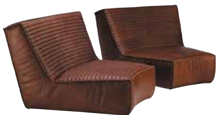
Fauteuil FARNIENTE courbe/curved Cuir / leather 9 finitions disponibles / 9 available finishings L110 P110 H77 cm - réf. F265