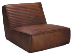
Fauteuil FARNIENTE droit/straight Cuir / leather 9 finitions disponibles / 9 available finishings L92 P121 H77 cm - réf. F265