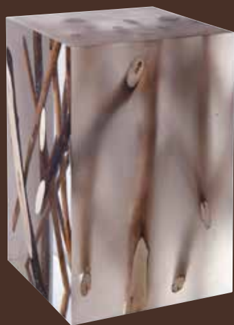
Bout de canapé KISIMI FROSTED Verre acrylique poli et dépoli et branches de bois flotté Polished and frosted acrylic glass and driftwood branches L30 P30 H45cm - réf.FI63F