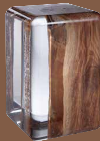
Bout de canapé NILLEQ ICE Verre acrylique et tronc de bois flotté Acrylic glass and driftwood trunk L30 P30 H45cm - réf.F162R