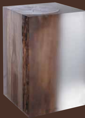
Bout de canapé NILLEQ FROSTED Verre acrylique poli et dépoli et tronc de bois flotté Polished and frosted acrylic glass and driftwood trunk L30 P30 H45cm - réf.FI62F