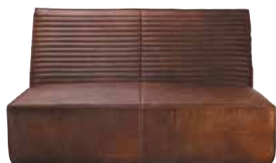
Canapé 2 places FARNIENTE Cuir / leather 9 finitions disponibles / 9 available finishings L138 P121 H77 cm - réf. F266