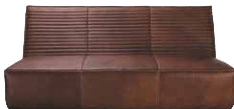
Canapé 3 places FARNIENTE Cuir / leather - photo : rebel 9 finitions disponibles / 9 available finishings L179 P121 H77 cm - réf. F267